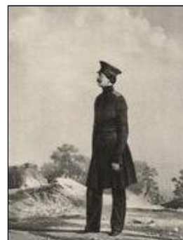
Резервный казак Сибирского линейного казачьего войска. 1812-1825 годы